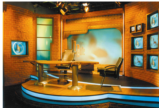
LIGHT-PAD® STREIFEN Anwendung Studio Dekoration ZDF