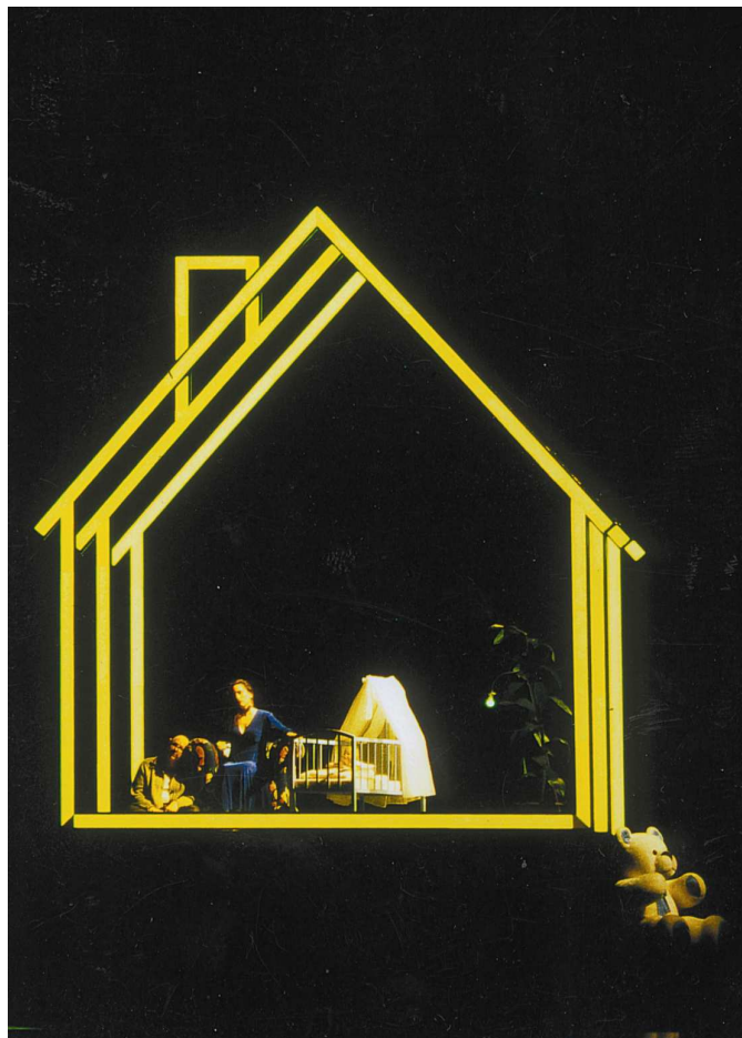
Oper Schlachthof 5 Staatsoper München Bühnenbild Gottfried Pilz

Diese Art der LIGHT-PAD® Farben haben die Eigenschaft das die Differenz im Farbton zwischen aktiv und gering ist. In den Farbbereichen zwischen rot und gelb lassen sich mit dieser Farbgebung wesentlich höhere Leuchtdichten erzielen